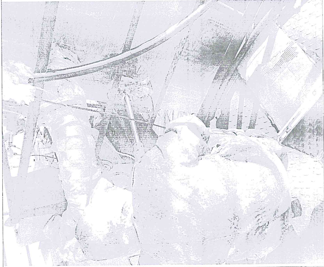
有组织废气点位实景图